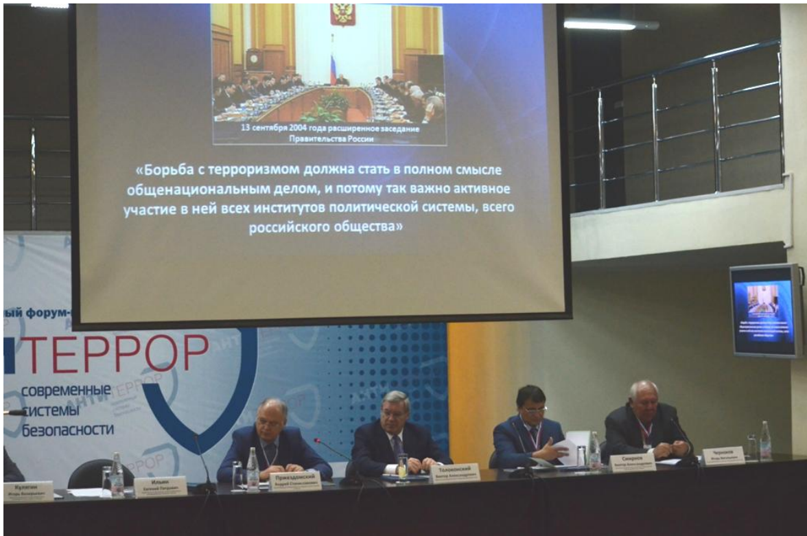
Открытие научно-практической конференции