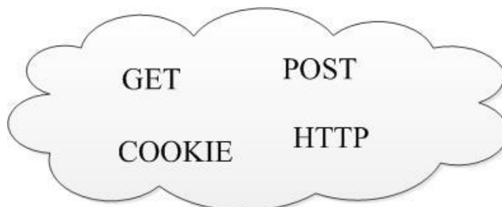
Рисунок. Множество данных

Другим большим недостатком является маленькое покрытие пользовательских данных. Правилom безопасных web-приложений считается не доверять никаким данным, которые может модифицировать пользователь. Эти данные можно представить в виде множества «А», которое состоит из четырех составляющих: GET, POST параметров, данных COOKIE и HTTP заголовков (рис.).