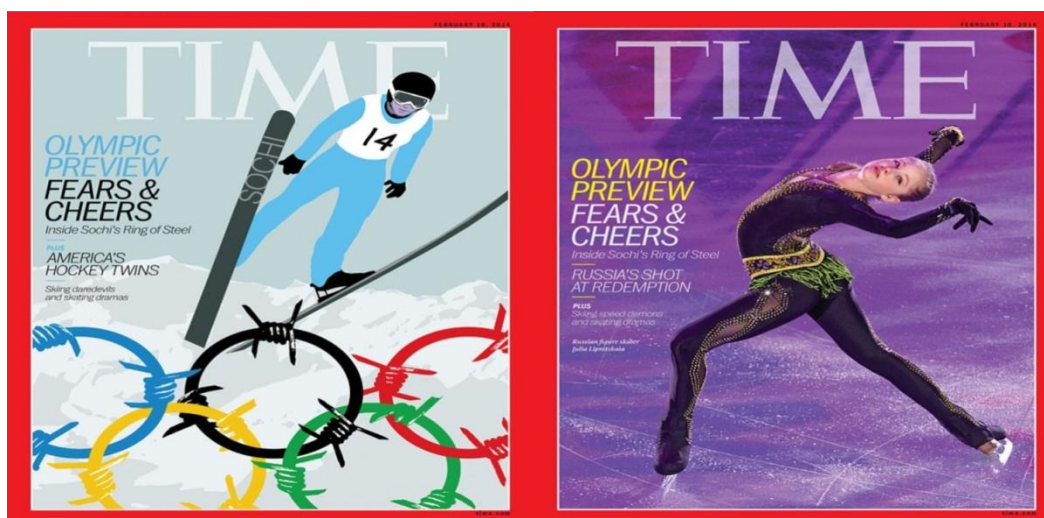
Рисунок. Обложка журнала «Time» вышедшего в феврале 2014 года в США (слева) и в Европе (справа)

На примере Олимпиады 2014 г. в Сочи видно, как многие блогеры, иностранные и российские СМИ в самом начале Олимпиады активно уверяли пользователей, что в Сочи все очень плохо организовано. Интернет пестрил выпусками типа «Ляпы олимпиады», а известный журнал «Time» в США вышел в феврале с обложкой, на которой изображен трамплингист, на лыже которого надпись «СОЧИ», а внизу страницы – разноцветные олимпийские кольца, выполнение в виде колючей проволоки. На обложку вынесен заголовок статьи «Olympic Preview: Fears & Cheers» (перевод автора: «Предпросмотр олимпиады: Опасения и Удивление»). Причем этот же журнал вышел в Европе с обложкой, на которой размещена фотография российской фигуристки чемпионки Олимпиады 2014 г., чемпионки Европы 2014 г. Юлии Липницкой. Такое распределение тематики говорит о направленности пропаганды. Для одних Россия – ГУЛАГ, для других – страна чемпионов.