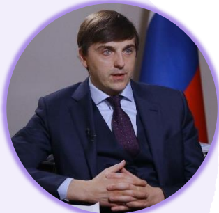
Сергей Кравцов Министр просвещения Российской Федерации

В ходе семинара-совещания для участников федерального проекта «Профессионалитет» (22 июня, Краснодарский край)